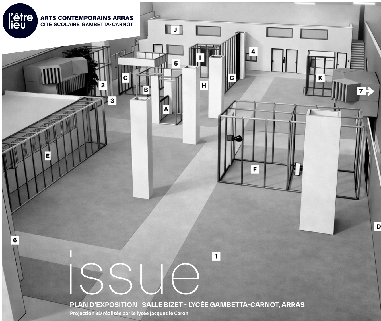
PLAN D'EXPOSITION SALLE BIZET - LYCÉE GAMBETTA-CARNOT, ARRAS Projection 3D réalisée par le lycée Jacques Le Caron